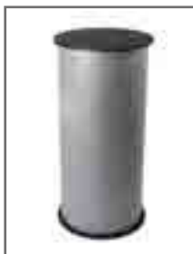
Produit avec tablette noire