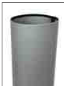
Montage de la jupe