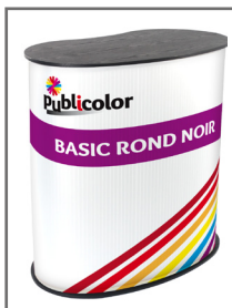
Produit avec tablette noire