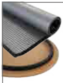
Montage de la jupe