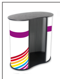
Comptoir - Dos